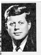
John Fitzgerald Kennedy 20th President of the United States Born May 29, 1917 Inaugurated January 20, 1961 Died November 22, 1963